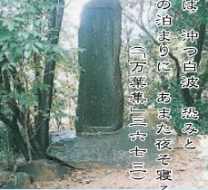
風吹け聲 能許の泊まりに 沖つ白波 送る 〔万葉集三六七三〕 あまの夜を寝る

노코라는 지명이 문헌에 처음 등장한 노래로, 아라쓰에서 출항한 전신라사(遣新羅使) 가노코의 도마리(현재의 가라도마리)에서 순풍을 기다릴 때의 기분을 노래하고 있습니다.