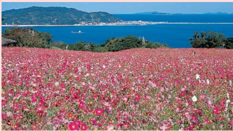
날씨에 따라 개화 시기가 다소 달라질 수 있습니다.