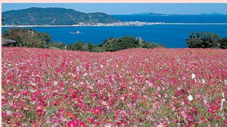
因气候影响以上花历和实际花历多少有些差别。