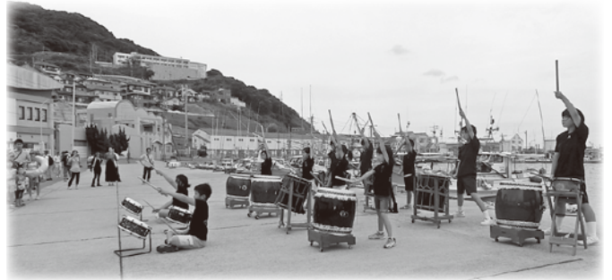
↑ 玄界太鼓でお出迎え：一生懸命な演奏に感動！