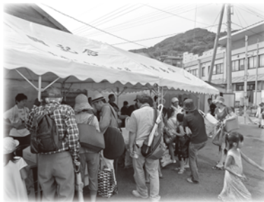
↑ 島の特産物直販所