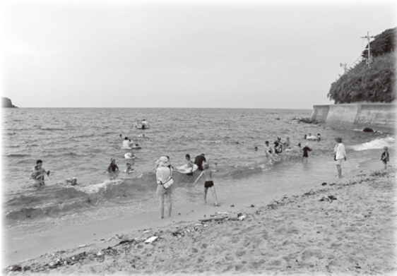
↑ 海水浴：家族連れでにぎわって いました♪