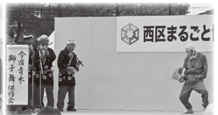
↑ 今宿青木獅子舞保存会