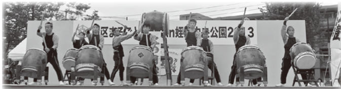
↓ 今宿・玄洋子ども太鼓