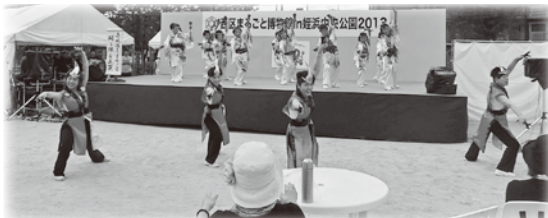
↑ 壱岐活きまるごと踊り隊&美麗