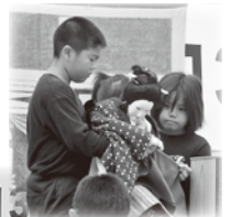
今津人形芝居保存会↓