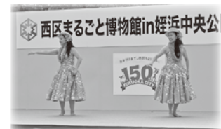
↑ 愛宕フラサークル