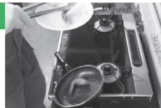
フライパンから内容物を取り出したときに落下した様子