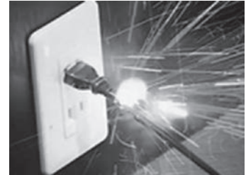
断線してショートし火花が散る様子

事例① 電気ケトルを使用中にコンセントの根元の部分が突然発火し、危うく火事になるところだった。コンセントの外観に特に異常はなかった。