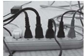
接続可能な消費電力を超えた不適切な使用の例

事例② 電源タップに、接続可能な最大消費電力を超えた電気製品を接続して使用していたため、コードが異常発熱して出火し、周辺を焼損した。