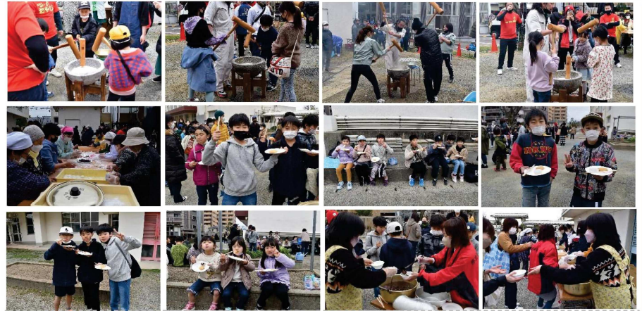
3年ぶりの開催！朝から各団体の会長・役員さんたちが準備して、先生たちもお父さんたちも大活躍！弥生っ子のために頑張りました。みんな良い笑顔です♪

弥生校区の皆様から温かいお心遣いをたくさんいただき、感謝の気持ちでいっぱいです。今後ともどうぞよろしくお願ひ申し上げます。