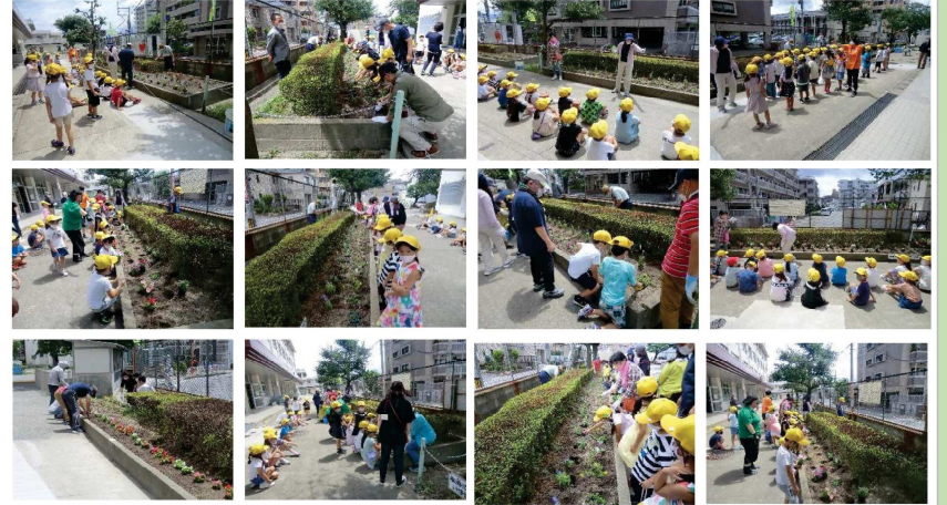
命輝く弥生っ子を育てる会