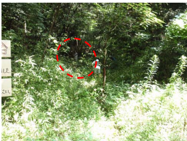
作業前（登山道が見えません）