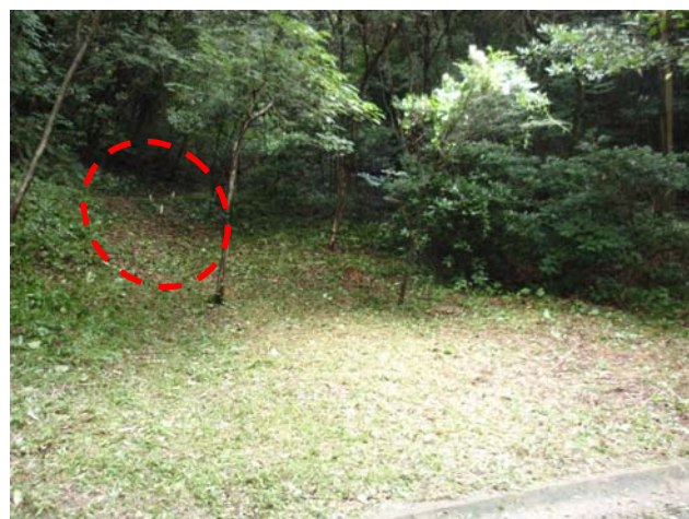
作業後（登山道が見えるようになりました）