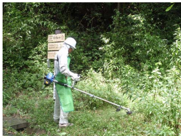
茎の細い草は草刈機で刈り取ります。