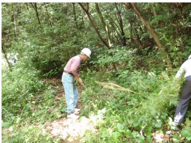
草刈機で刈れない茎の太い草を鎌で刈り取ります。