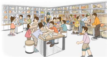
◆オーブンラボでのものづくり