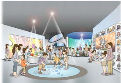
◆デジタルコンテンツを使った展示等