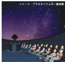
◆プラネタリウムの一般投影