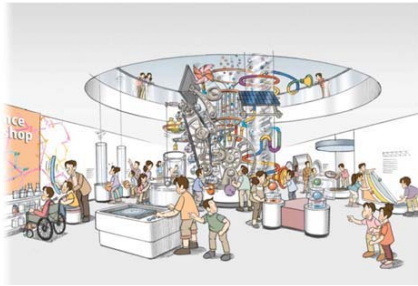
◆科学の原理・法則に関する展示