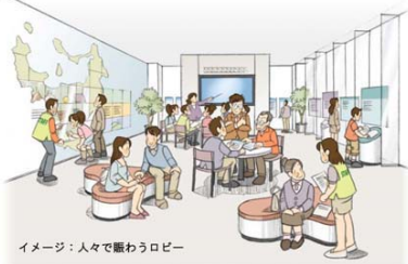
◆人で賑わうロビー