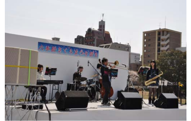
～イベント会場の様子～