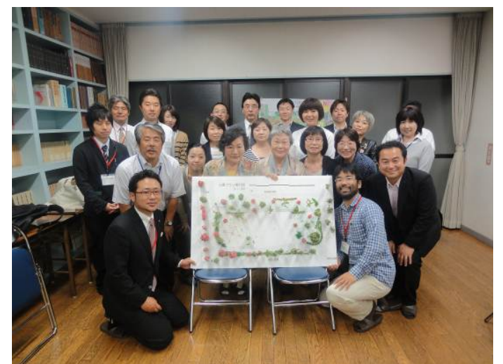
◆第5回 ワークショップ参加者で記念撮影

【お問い合わせ先】福岡市住宅都市局都市計画部都市計画課 TEL 711-4388 大学移転対策部九大跡地計画課 TEL 711-4154