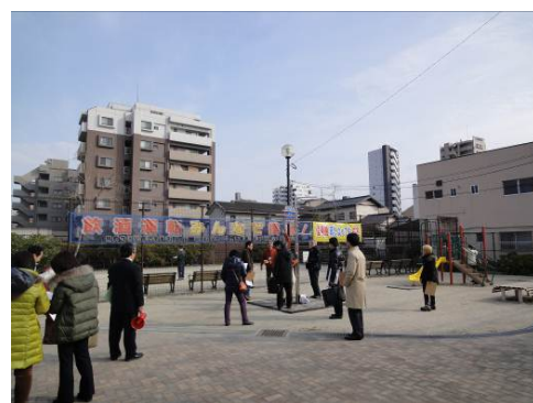
◆第2回 鳥飼公園視察の様子