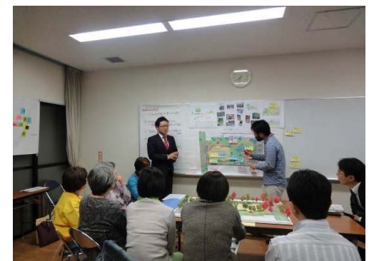
◆第4回 全体ディスカッションの様子