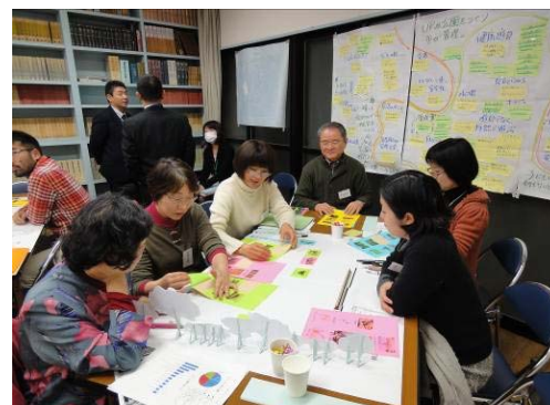
◆第3回 プランづくりの様子