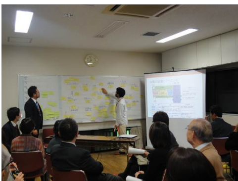
◆第1回 全体ディスカッションの様子