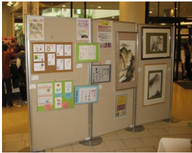
一年間の成果を展示