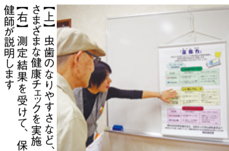
【上】虫歯のなりやすさなど、さまざまな健康チェックを実施 【右】測定結果を受けて、保健師が説明します

11月4日に美野島公民館で健康チェックイベント(美野島衛生組合連合会主催)が開催され、地域の皆さん61人が参加しました。