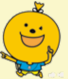
福岡市健康づくりイメージキャラクター よからーもん