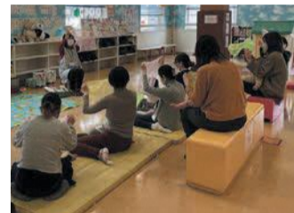
読み聞かせの合間に、手遊び歌も歌いました

親子で楽しく「子どもプラザ」で遊ぼう 子育て中に、「遊びに行くところがない」「引越したばかりで友達がいない」など、悩んでいませんか。子どもプラザは、子育て家族を応援しています。市は、乳幼児とその保護者が無料で利用できる子どもプラザを、区内2カ所(山王、博多南)に、常設しています。おもちゃなどで自由に遊べるほか、保護者同士の交流の場にもなっています。