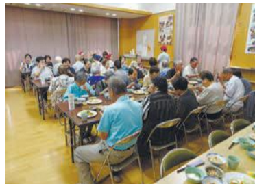
板付北校区で行われた食事会

共食とは? 共食とは、家族や友達、職場の人や地域の人など、誰かと共に食事をすることをいいます。 市が策定した「第3次福岡市食育推進計画」では、食を楽しむ福岡の食文化を次世代に伝えていくために、共食の役割が重要とされています。 しかし、最近では社会環境やライフスタイルの多様化により、一人で食事をする「孤食」や、好きなものばかり食べる「固食」、子どもだけで食事をする「子食」などさまざまな「こ食」が増え、共食の機会が減っています。