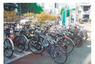
歩道にはみ出している放置自転車