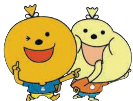
よかろーもん・はちやろーもん

共食とは? 共食とは、家族や友達、職場の人や地域の人など、誰かと共に食事をすることをいいます。 市が策定した「第3次福岡市食育推進計画」では、食を楽しむ福岡の食文化を次世代に伝えていくために、共食の役割が重要とされています。 しかし、最近では社会環境やライフスタイルの多様化により、一人で食事をする「孤食」や、好きなものばかり食べる「固食」、子どもだけで食事をする「子食」などさまざまな「こ食」が増え、共食の機会が減っています。