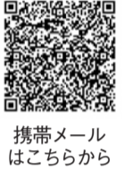
携帯メールはこちらから

①横浜FC戦に招待 期8月4日(日)午後6時キックオフ対区内に住む高校生以下とその家族の2人1組定抽選200組(400人) ②「エスコートキッズ」も同時募集 試合当日にアビスパの選手と手をつないで入場する「エスコートキッズ」を募集します。対区内に住む小学生(要保護者同伴)定抽選11人 ①②共通 所レベルファイブスタジアム(東平尾公園二丁目)問博多区企画振興課 ☎419-1043 F434-0053問無料☎メール(t-shinko.HAWO@city.fukuoka.lg.jp)に応募事項を書いて6月3日(必着)までに同課へ。*エスコートキッズの希望者は「エスコートキッズ希望」と明記。