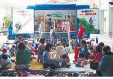
約550冊の本を載せたキャラバンカー

キャラバンカーがやってくる 「本とおそぼう全国訪問おはなし隊」がたくさんのおはなしの本を車に載せてやってきました。期5月26日(日)午後3時~3時半=キャラバンカー内部の見学、絵本の閲覧▷午後3時35分~4時5分=絵本のおはなし会所さざんぴあ博多(南本町二丁目)問博多南図書館 ☎502-8580 F502-8579問無料☎不要