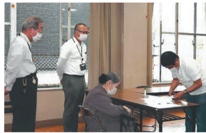
申請書の書き方を丁寧に説明

地域の身近な相談相手 民生委員・児童委員・児童委員 民生委員・児童委員は、地域から推薦され、厚生労働大臣の委嘱を受けたボランティアです。高齢者や子どもの見守りを行い、住民からの生活上の相談に応じています。 地域を支えている民生委員・児童委員の活動の中から、那珂南校区の活動を紹介します。 ■地域の見守り 那珂南校区民生委員児童委員協議会の役員の方々は「日頃から地域の人々を気に掛け、声を掛けながら見守ることで、お互いの信頼関係を築いています」「やりがいを感じながら、親身になって悩み事の解決に取り組んでいます」と話しています。