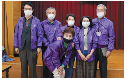
チームワークを大切に活動しています

民生委員・児童委員は、コロナ禍でも工夫して活動を続けています。守秘義務があるためプライバシーは守られます。安心して、困り事や心配事をご相談ください。 ◇ ◇ 民生委員・児童委員は、えましました。日頃の見守りがあるからこそ、どんな相談も見逃さず、支援につなげられます」と活動の成果を語りました。