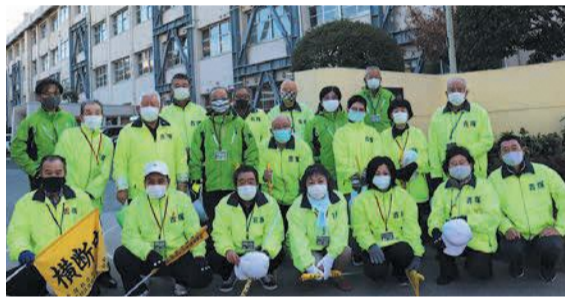
ボランティアの皆さん