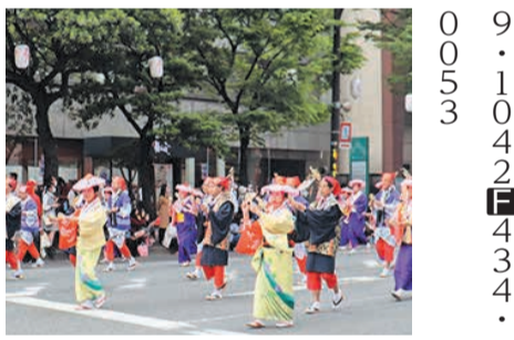
男恵比寿と女恵比寿が馬に乗って訪問(昨年)

演舞台の出演団体や出演時間については、ホームページ(「博多区演舞台」で検索)や、当日会場で配られるチラシをご覧ください。