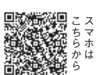
スマホからこちらから

☎先着20組☎無料☎☎5月1日(火)午前9時30分から5月10日(金)までに区ホームページ(「博多区 ほやほやママの子育て教室」で検索)内の申込フォームで受け付け。☎母子健康手帳、子どもの身の回りで必要なもの