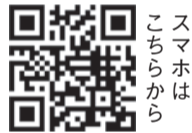
スマホはこちらから

📍 スタート地点はJR博多駅 スタンプを集めながら、中洲川端・御供所の地区を歩いて巡ります。ス