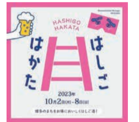
はしごはかたロゴマーク

期間中、店舗によっては、お得なサービスを受けられるチケットを、「博多町家」ふるさと館前で2,400円(600円4枚つづり)で販売します。オンラインでは、事前に400円引きで購入できます。購入方法や対象店舗など、詳しくは公式Instagram(「@hashigo_hakata」で検索)でご確認ください。