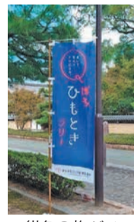
紺色の旗がスポットの目印

承天寺や東長寺など、「ひもときスポット」5カ所に、博多について学べるクイズを用意しています。スポットにある回答用紙に答えを記入し、「博多町家」ふるさと館で答え合わせをすると、博多にまつわるオリジナルの景品がもらえます。