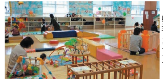
山王子どもプラザ