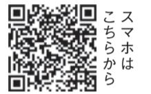
スマホはこちらから

※ミニ講座や専門相談などのため予約が必要な場合があります。詳しくは各プラザに問い合わせるか、市ホームページ(「福岡市子どもプラザ」で検索)をご確認ください。