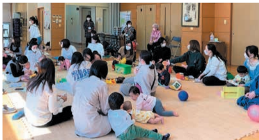
他の親子と交流しながら自由に過ごします

3月15日には、生後2カ月～2歳の乳幼児と保護者19組が集まり、保健師の育児相談や体重測定のほか、がん検診についてなど保護者の健康づくりの講話が行われました。初め