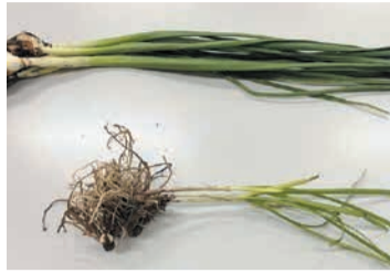
上がスイセンで下がニラです

有毒植物を食用と間違えて食べてしまい、食中毒になる場合があります。例えば、花が散った後のスイセンはニラとよく似ています。スイセンによる中毒では、吐き気や下痢、発熱などの症状が現れます。