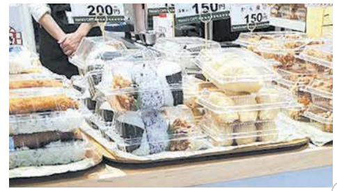
のり弁やおにぎりなど商品の種類が豊富

区役所1階に5月6日、テイクアウト専門の「マズカフェ」が開店しました。立花高等学校(東区和白丘)にあるカフェの支店で、障がい者を支援する事業所が運営しています。コーヒーなどのカフェメニューの他に、パンやおにぎり、唐揚げといった各種総菜を販売しています。