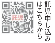
託児申し込みはこちらから