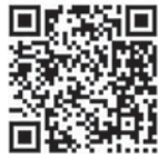
スマホはこちらから

8月9日(火)午前10時～午後6時(1人につき20分) 博多体育館(山王一丁目) ☎481-0301 📠481-0302 先着20人 1500円 同体育館窓口または、電話で受け付け。受付期間は、ホームページ(「博多体育館」で検索)で確認するか、同体育館まで問い合わせを。 動きやすい服装(スカート不可)