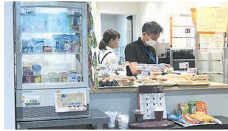
明るい店頭にお弁当や飲料、お菓子が並びます