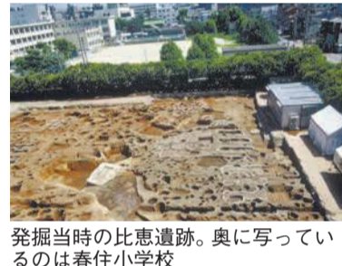
発掘当時の比恵遺跡。奥に写っているのは春住小学校