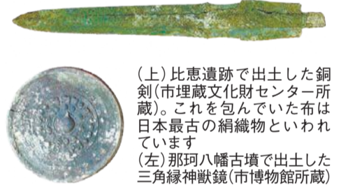
(上) 比恵遺跡で出土した銅剣(市埋蔵文化財センター所蔵)。これを包んでいた布は日本最古の絹織物といわれています (左) 那珂八幡古墳で出土した三角縁神獣鏡(市博物館所蔵)