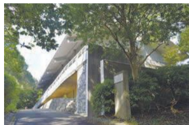
展示館は自然豊かな「弥生の森」に囲まれ散策にもぴったりです

【金隈遺跡甕棺展示館】 所金の隈一丁目39-52(福岡外環状道路「立花寺北交差点」から車で約4分) ☎503-5484 料無料 開午前9時~午後5時(入館は4時30分まで) 休月曜日(祝休日の場合は翌平日)、12/29~1/3 地図はこちら