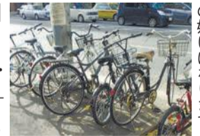
放置自転車は通行の妨げになります