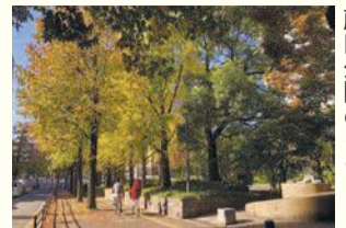
藤田公園のイチヨウ

区の人口 243,559人 (前月比 139人増) (男 116,216人 女 127,343人) 世帯数 153,049世帯 (前月比 80世帯増) (令和元年10月1日現在推計)