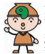
市埋蔵文化財センター キャラクター「コウコ」

金隈遺跡を「ご存じですか」 博多区には、数多くの文化財や史跡があります。その中から、国指定史跡「金隈遺跡」を紹介いたします。