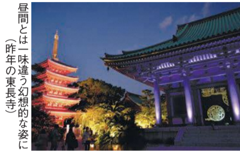
昼間とは一味違う幻想的な姿に(昨年の東長寺)

10月24日(木)午前10時～正午 三筑会館(諸岡六丁目) 区生涯学習推進課 ☎419-1024 ☎419-1029 小中高生の保護者 先着30人 料100円(茶菓子代) 電話かファクス、はがき(〒812-8512住所不要)、メール(gakushu.HAWO@city.fukuoka.lg.jp)に応募事項を書いて前日までに同課へ。