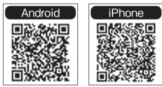
Google Play 版 App Store 版

「災害時は電話がつながりにくくなったり、情報が一方通行になったりして、不安が募りがちです。災害には遭いたくないですが、万一遭ったときに情報が共有できると心強いですね」と話してくれ