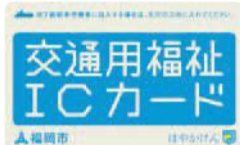
地下鉄やバスなどで利用できる交通用福祉ICカード

9月3日(月)から平成30年度高齢者乗車券を交付します。交付対象者や種類、手続きに必要なものなど詳しい内容は、本紙6面でご確認ください。