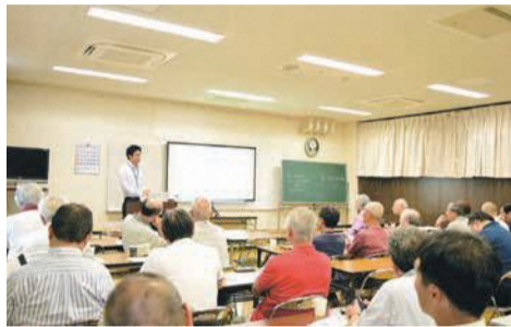
「日頃使わないものは」