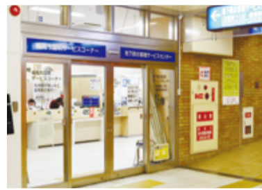
博多駅証明サービスコーナーの入口

住民票や戸籍、印鑑証明書等の取得だけでなく、博多駅・天神・千早にある証明サービスコーナー(左表)が、区役所に比べて待ち時間が短く便利です。 土日祝日も午前9時から