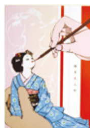
【グラフィックデザインの部】竹下慎貴「博多美人形」