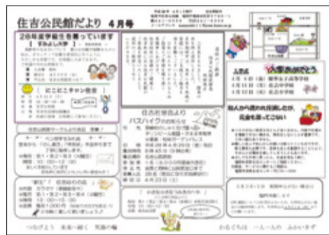
全戸配布の公民館だより (写真は住吉公民館)

公民館は小学校区を基本として、区内に22館が設置されています。毎月1日発行の「公民館だより」には、公民館の講座や、季節ごとの地域イベントなどの情報が満載。また、古紙などの資源物の回収場所や、母子巡回健康相談の日時など行政からのお知らせも掲載されています。