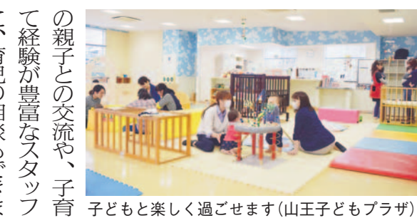
子どもと楽しく過ごせます(山王子どもプラザ)

情報が満載のマップです。区内の保育所・幼稚園や公民館が分かる地図に加え、お薦めの公園や夜間・休日の急患診療に関する情報を掲載。区保健福祉センターや区内の子どもプラザなどで配布しています。