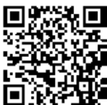
携帯電話はこちらから

スマートフォンを使って、窓口の待ち人数をリアルタイムで確認できます。 対象の窓口は市民課・保険年金課と証明サービスコーナーです。区のホームページ(「博多区 ウェルカムラネット」で検索)または左の2次元バーコードを読み取ってご覧ください。 ※3月と4月は駐車場も混雑します。なるべく公共交通機関をご利用ください。 【問い合わせ先】 区市民課 ☎419-1017 ☎482-7640