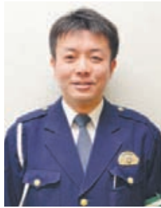
■朝夕の交差点に注意 自転車事故は、朝夕の

近年、自転車事故の総件数は減少傾向にありませんが、歩行者と自転車の事故や、自転車同士との事故が増えており、自転車