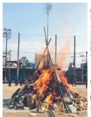
堅粕・東光校区のどんど焼き(昨年)

1月17日(日)に板付北小 学校で開催される交歓会 は、板付、板付北、三 筑、那珂、那珂南、弥生 の6校区による合同行事 です。