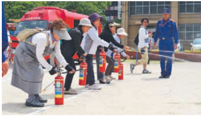
【上】一定の距離を取り、慌てず落ち着いて、噴射しましょう 【右】川に沿って土のうを積み上げ、浸水を防ぎます

開=日時、開催日、期間 所=場所 問=問い合わせ ☎=電話 F=ファクス 対=対象 定=定員 料=料金、費用 託=託児 申=申し込み 持=持参 送=メール HP=ホームページ