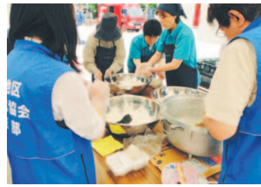
炊き出し用のおにぎり作り