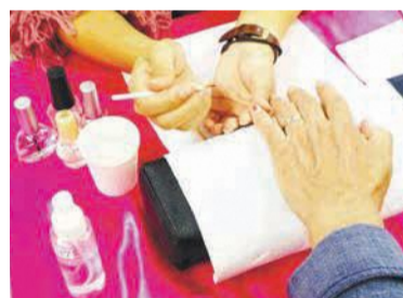
無料ネイルアート体験

■ お口の健口チェック 歯科衛生士が口臭の強さや舌ブラシの使い方チェックします。