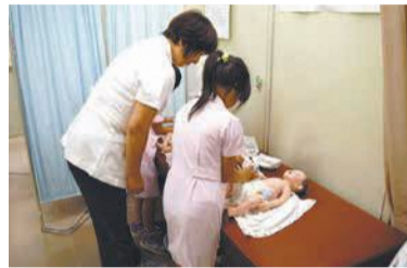
赤ちゃん人形のお世話を する看護師体験

■ 事業所販売 (午前10時～午後3時) 障がい者施設の皆さんが作ったパンやクッキー、雑貨などを販売します。 ■ タッチパネルで物忘れチェック (午前10時～12時) タブレットを使った認知症の早期発見ツールを体験できます。☎60歳以上 ※午前10時から整理券を配布。