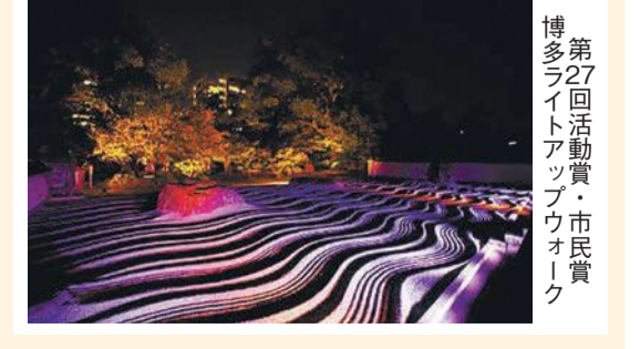
第27回活動賞・市民賞 博多ライトアップウォーク

市は、市内の魅力ある景観を2年に1度表彰しています。お気に入りの景観を推薦してください。募集期間は、9月10日(消印有効)までです。詳しくは、市ホームページ(「福岡市都市景観賞」で検索)をご覧ください。☎市都市景観室 ☎711-4589 ☎733-5590