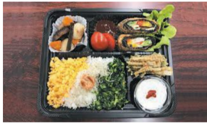
主食・主菜・副菜の揃ったヘルシーランチ(昨年)

■ 健康日本21〇×勝ち抜きクイズ (午後2時40分～3時) ホテル宿泊券や食事券などの賞品がもらえる健康に関する勝ち抜きクイズを実施します。子どもから大人まで参加できます(クイズ開始後は途中参加不可)。