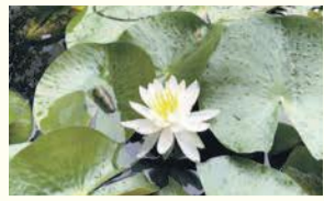
東長寺の古代ハス

博多区役所 〒812-8512 博多区博多駅前二丁目9-3 区ホームページ 博多区 検索 区役所代表電話 ☎ 441-2131