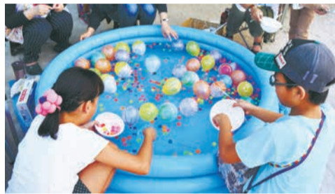
子どもたちに人気のスーパーボールすくい(月隈)

地域の人が参加してにぎわいます。みんなでやぐらを囲んで踊る盆踊りや、地元の人たちによる自慢の夜