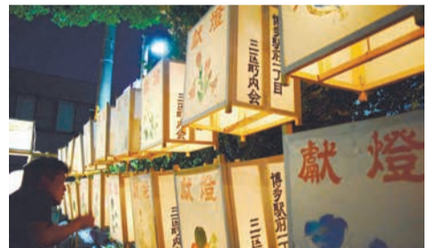
謝国明大楠様千灯明祭のちょうちん