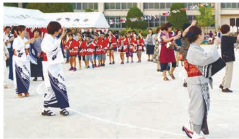
大人も子どもも輪になって踊ります(月隈)