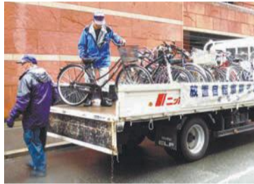
自転車の撤去作業

博多駅周辺など自転車放置禁止区域を中心に、街頭指導員の配置及び放置自転車の即日撤去を実施していきます。【自転車対策・生活環境課】