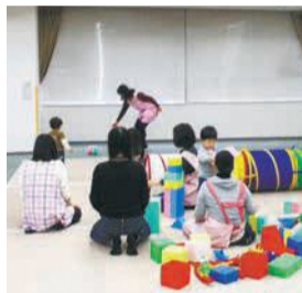
ママのほっとカフェ はかたん

妊娠期から子育て期までの切れ目ない支援を強化します。【健康課 子育て支援課 地域保健福祉課】