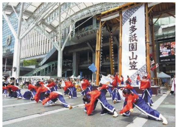
昨年のキャンペーン

7月は「社会を明るくする運動」「福岡市青少年の非行・被害防止」の強調月間です。青少年の健全育成・非行防止の意識を高めるため、博多保護区保護司会と共に、福岡親善大使や精華女子高等学校吹奏楽部を招いて啓発キャンペーンを行います。期7月7日(土)午後2時~3時 所博多口駅前広場 区企画振興課 ☎419-1043 F434-0053