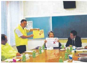
東吉塚校区での地域と区役所の懇談会