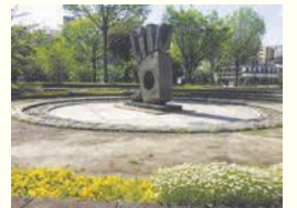
中比恵公園(博多駅前二丁目)