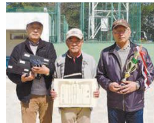
優勝した東光寺町チーム

【大会結果】優勝=那珂校区(東光寺町チーム)、準優勝=三筑校区(諸岡4丁目3区Bチーム)、3位=堅粕校区(比恵2区)、住吉校区(住吉パートA)、大浜地区(大浜A)