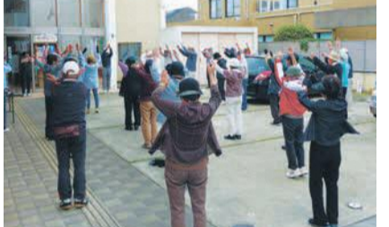
ウォーキング前に皆で準備体操