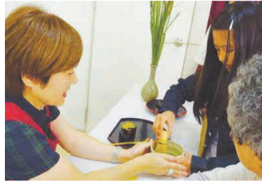
三世代ふれあいカフェで抹茶体験

東吉塚校区では「三世代ふれあいカフェ」Ⅱ上写真Ⅱを年3回開催しています。毎回参加者が増え、前回は子どもからお年寄りまで60人以上が参加しました。皆で子どもたちを見守るので、お母さんたちも安心して楽しめます。