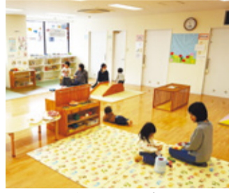
博多南子子どもプラザ