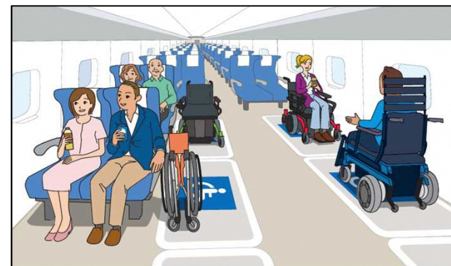
＜新幹線の車椅子フリースペースのイメージ例＞