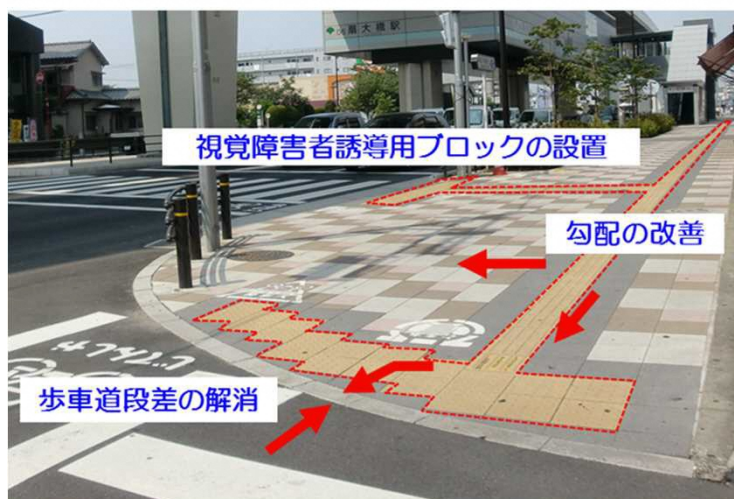
道路のバリアフリー化整備事例