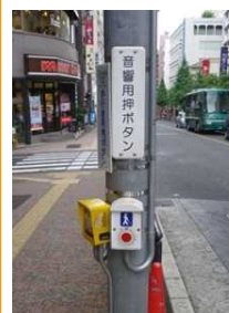
＜音響機能付加信号機の例＞