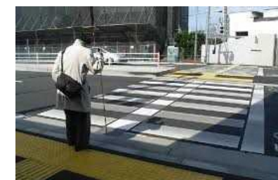
＜エスコートゾーンの例＞