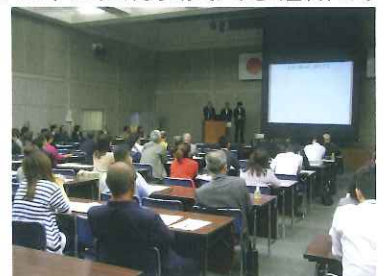
中間報告会の様子(23年10月)

委託でも補助でもなくNPOと市が対等な立場で取り組む事業手法や、提案・審査や事業実施過程での市民への情報公開、成果の振り返りと評価を適正に行うプロセス等は、多くの市民のみなさまから支持されています。