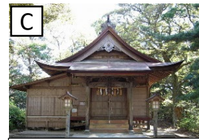
叶嶽神社 (将軍地蔵堂)