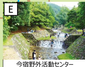
今宿野外活動センター