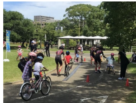
親子自転車教室の様子