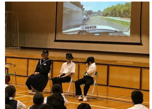
VRを活用した体験型の 自転車教室（出前講座）