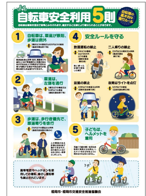
自転車安全利用5則チラシ

外国語FM放送局（ラブエフエム）での啓発、 転入時のウェルカムキットの配布や生活ガイ ダンスの実施