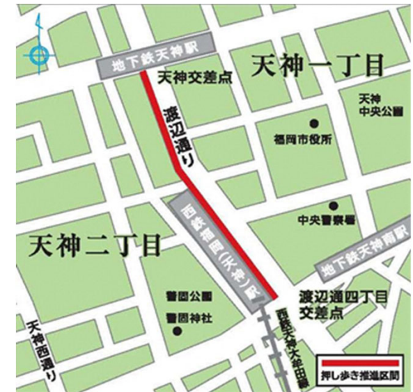
押し歩き推進区間の地図