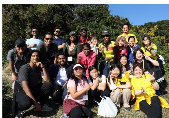
登山を通じて異文化交流