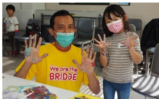
キッズアートプロジェクト