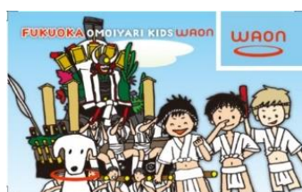
FUKUOKA OMOIYARI KIDS WAON

「 ふくおか おもいやり きっず わおん 」のご利用額の0.1%を「福岡市NPO活動支援基金」にご寄付いただいています。