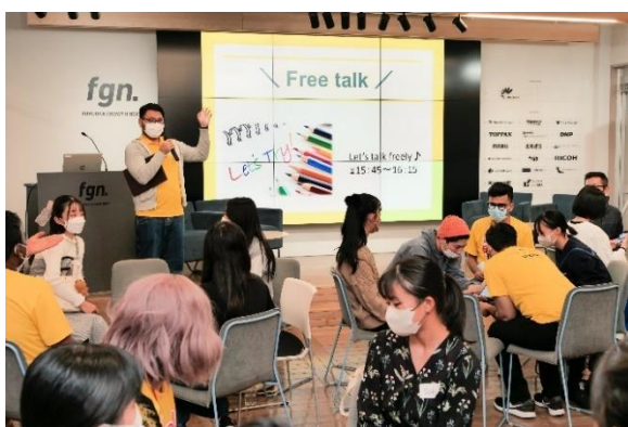
Global Startup Center とのコラボイベント