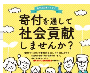
福岡市NPO活動支援基金