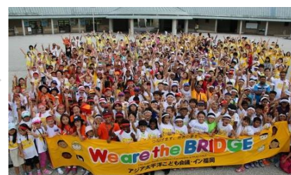
アジア太平洋子ども会議・イン福岡に助成