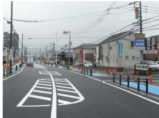
完成後 幅員22m（車道10m+歩道6m×2）