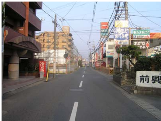
着工前 幅員6m 歩道なし