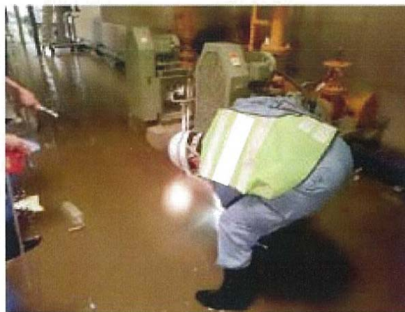
処理場に設置された機器の点検調査