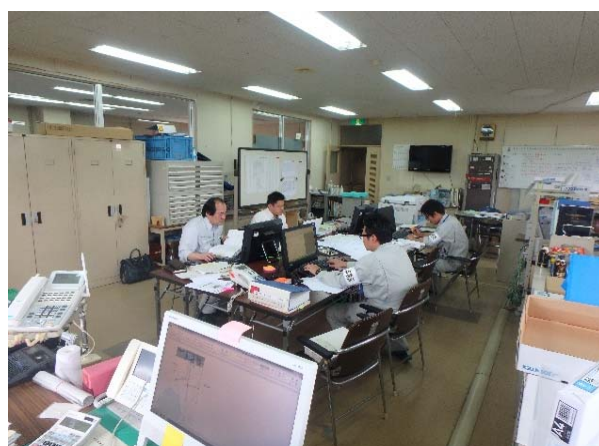
災害査定資料作成 ( (公社) 全国上下水道コンサルタント協会 )