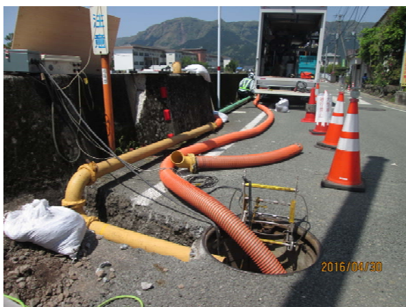
下水管閉塞による応急復旧作業 (汚水の流下機能を確保するためにポンプ や仮配管を設置)