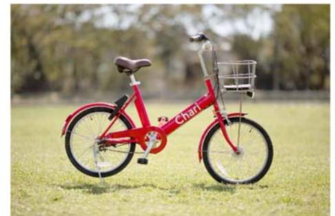
導入されるシェアサイクル（チャリチャリ）

※平成30年6月より共同で「福岡スマートシェアサイクル実証実験」を行っていた「Merchari(メルチャリ)」が令和2年4月から名称変更いたします。新サービス名への変更に伴う、サービスカラー、アプリ、利用料金を含むサービス内容に変更はございません。