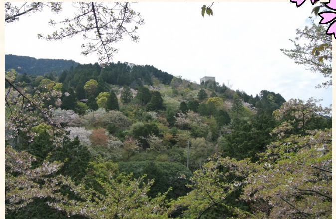
くすの木から花木園を望む

《お問い合わせ》 企画共創課（2階22番窓口） 電話 833-4009 FAX 844-1204