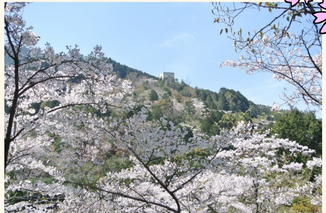
くすの木から花木園を望む