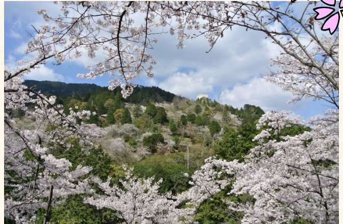
くすの木から花木園を望む