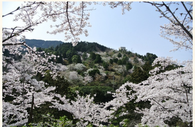
くすの木から花木園を望む